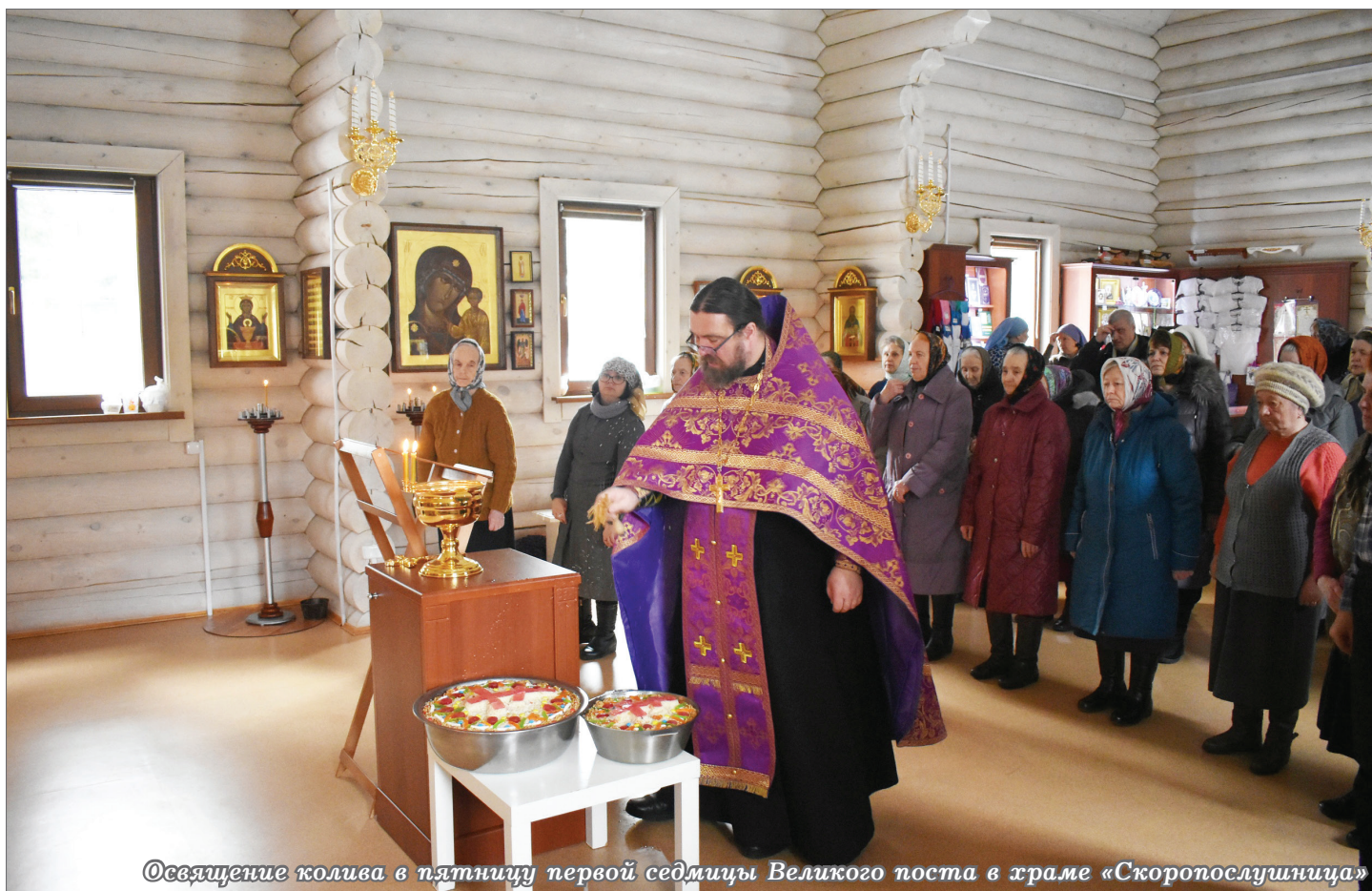
Освящение колива в пятницу первой седмицы Великого поста в храме «Скоропослушница»

Газета православного прихода храма «Скоропослушница» Нововятского района г. Кирова