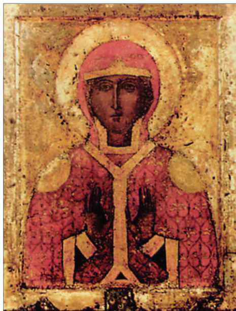
Образ святой мученицы Параскевы на оборотной стороне Феодоровской иконы

Чудотворный образ привлекает к себе отовсюду