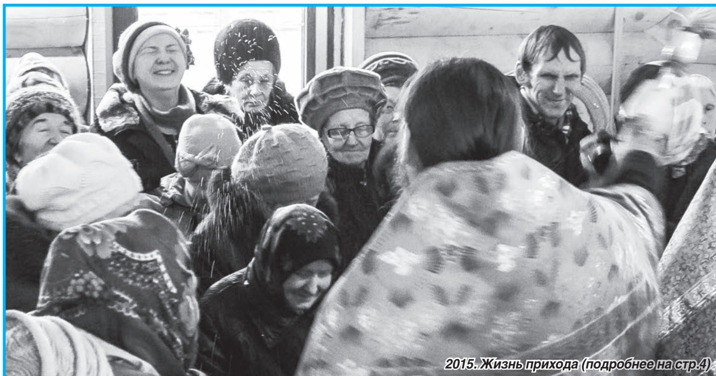
2015. Жизнь прихода (подробнее на стр.4)

Поздравляет с Новым годом и Рождеством Христовым!