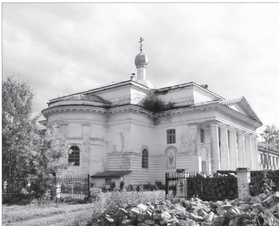
Храм Преображения Господня в селе Возгалы