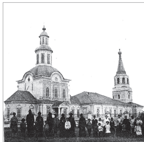
Церковь Сретения Господня в селе Березник Кумёнского района, 1912 г.