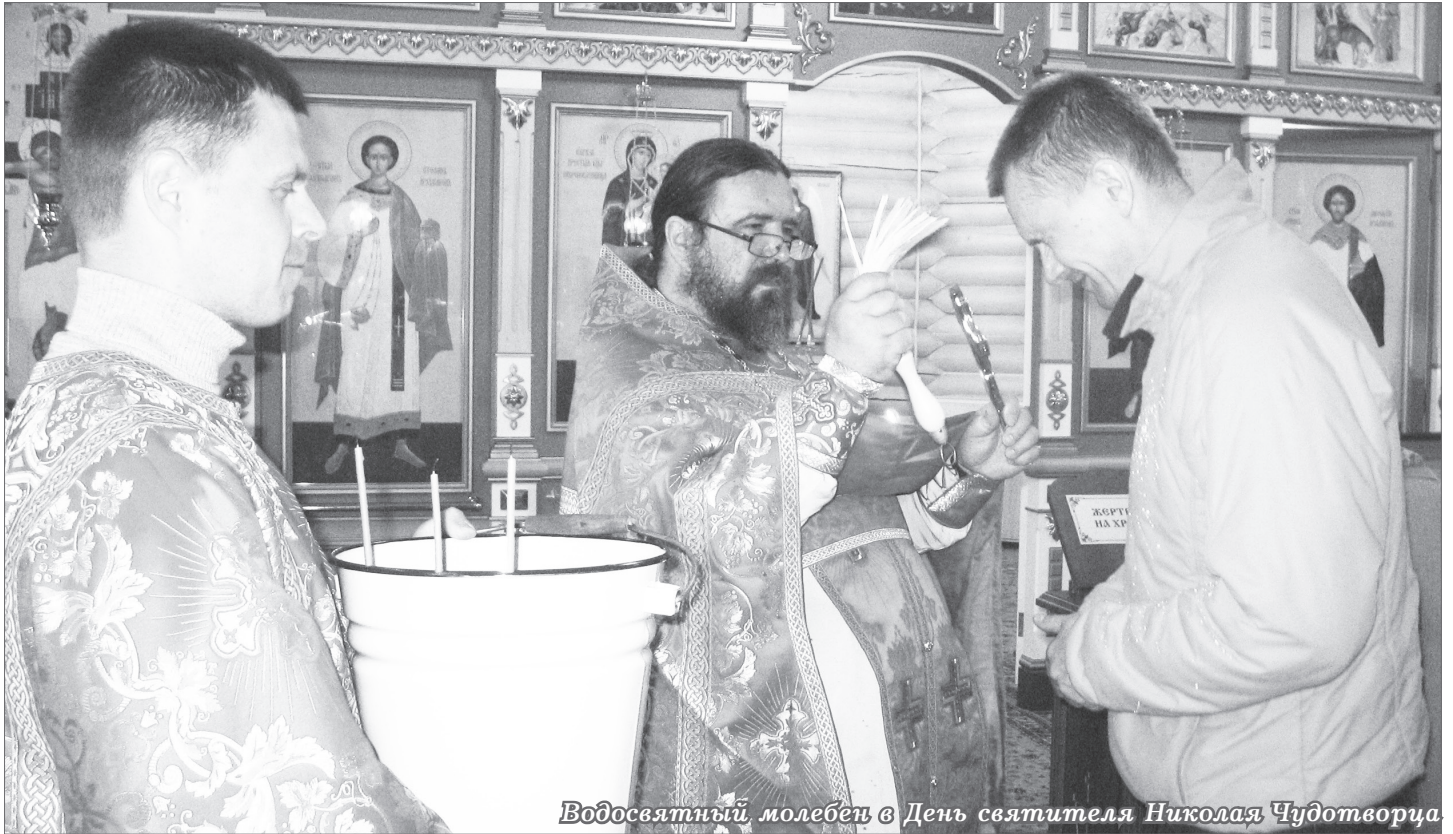
Водосвятный молебен в День святителя Николая Чудотворца

Газета православного прихода храма «Скоропослушница» Нововятского района г. Кирова